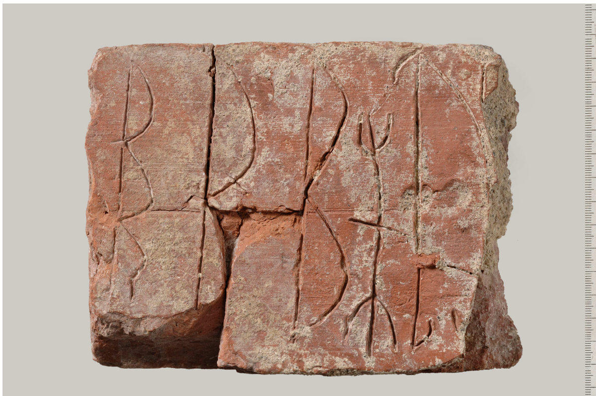
Den runristade tegelstenen (fyndnr 442) från Kv. Klostret i Strängnäs, Södermanland.

av bistaven är ganska bred. Till höger om den nedre delen av bistaven har delar av tegelytan fallit bort, men den vänstra hälften av ristningslinjen finns bevarad i brottkanten. Av den nedre delen av samma bistav ses ett stycke av den högra hälften av linjen i den högra brottkanten. Basen av huvudstaven saknas. 3 b har sluten form. Den nedre bågformiga bistaven är något bredare än den övre. Runa 4 är kortare än omgivande runor och ser ut som en samstavsruna mnr om den läses uppfrån och ned. Den antagna n -komponenten har dubbelsidig bistav (†) och det är inte omöjligt att den skall uppfattas som en æ -runa och λ -komponenten kan givetvis också utläsas som y . Runa 5 ser ut som en u -runa, där den nedre delen av bistaven nedtill böjer in något mot huvudstavens bas. Brottkanten till höger följer den nedre delen av denna bistav. Runan har i toppen en böjd bistav snett nedåt vänster som till t . Även basen på huvudstaven och bistaven är försedda med liknande bistavar som liknar två motställda krokar. Det är visst vilken betydelse dessa kan ha, men hypotetiskt kan de läsas som lt om man tänker sig att runan skall vändas upp och ned. En annan möjlighet är att de bara har en dekorativ funktion. I mitten av runa 5 finns avtryck efter tre fingrar placerade i trekant likt en kattfot. Dessa avtryck har gjorts i leran innan runan ristades. Efter runa 5 finns upptill en 4 cm lång något svängd linje, som delvis går parallellt med bistaven i denna runa och som sammanfaller med brottkanten.